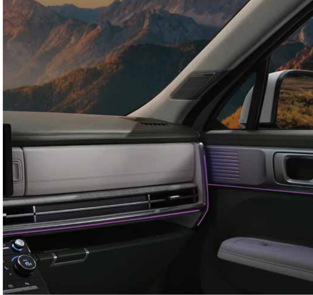
Ambiyans aydınlatması (64 renk)

Huzurlu ve rahat bir ortam oluşturmak için dengeli bir tasarıma sahip iç mekân, olağanüstü bir konfor sunuyor.