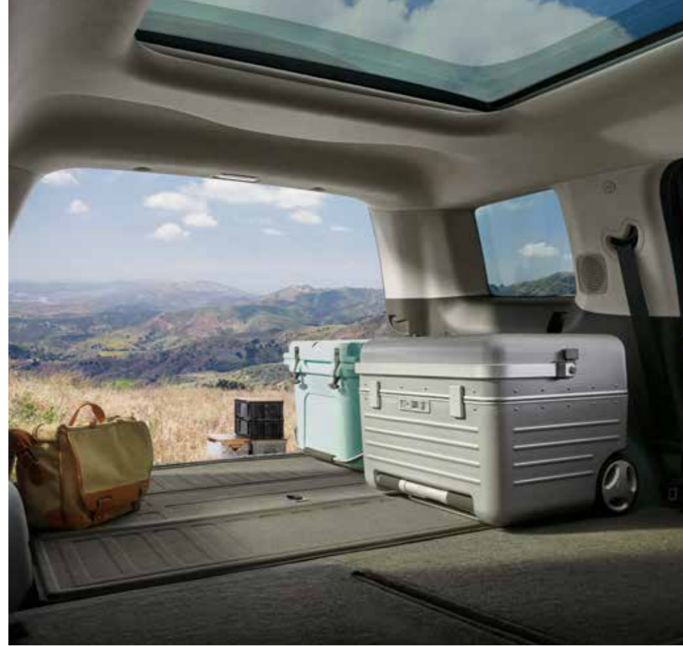
2'nci sıra katlanan koltuklar

SANTA FE, 7 koltuklu geniş araç içiyle büyük konfor sunuyor, hep daha fazlasına olanak tanıyor.