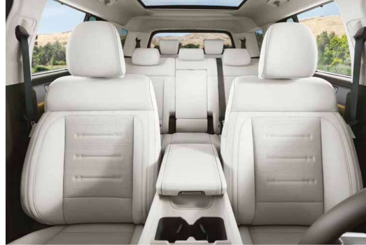
Deri, 7 koltuklu

SANTA FE, 7 koltuklu geniş araç içiyle büyük konfor sunuyor, hep daha fazlasına olanak tanıyor.